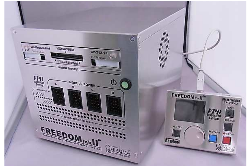
検査装置(本体+操作BOX)