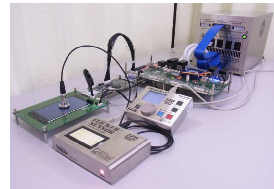
検査設備構成イメージ